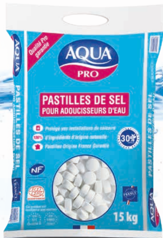
Conditionné en sac de 15kg et 25kg

* Détergent certifié par ECOCERT Greenlife selon le référentiel ECOCERT « Ecodétergent » disponible sur http://detergents.ecocert.com