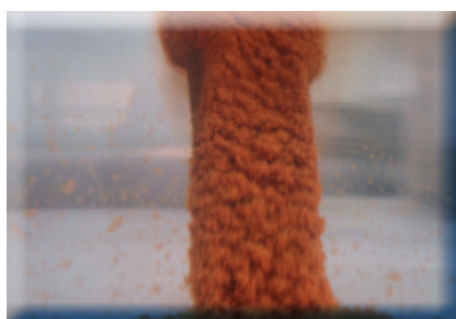
Solution saline «classique» Oxyde de fer (rouille)

L'eau des bassins peut être le siège de phénomènes de corrosion qui provoquent la dégradation des équipements métalliques des piscines. Les oxydes ainsi libérés peuvent se déposer sur les revêtements (liners, coques polyester...) et occasionner la formation de taches indélébiles.